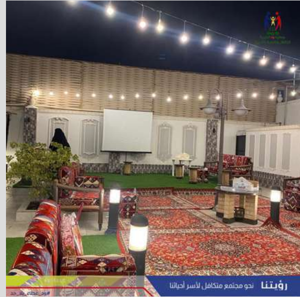
رؤيتنا نحو مجتمع متكامل لأسر أحياتنا