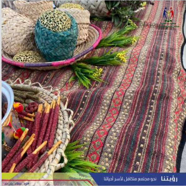
رؤيتنا نحو مجتمع متكامل لأسر أحياتنا